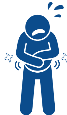
New GI symptoms (nausea, vomiting, diarrhea) Nuevos síntomas gastrointestinales (náusea, vómito, diarrea)