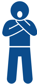
New shortness of breath Falta de aire nueva