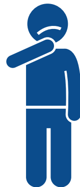
Sore throat Garganta irritada