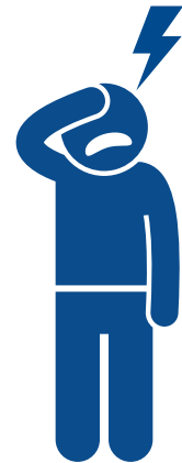
New headache Dolor de cabeza nuevo