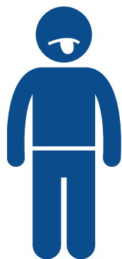
New loss of sense of taste or smell Nueva pérdida del sentido de paladar o de olfato