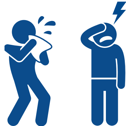
Congestion or runny nose Congestión o goteo nasal