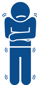
Body aches or chills Dolor corporal o escalofríos